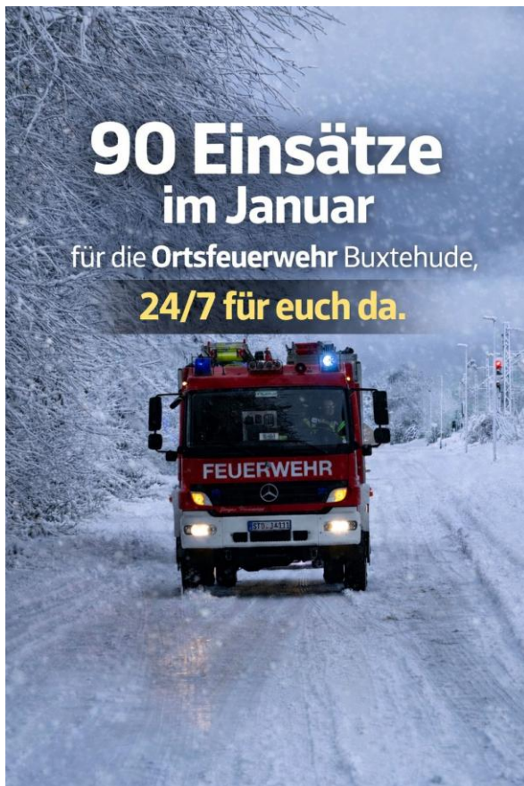
Einsatzzahlen Januar 2026 für Zug 1 und Zug 2

Das Jahr 2025 war rückblickend sehr aufregend und auch anstrengend. Über 300 Einsätze, viele Dienste, nette Treffen und ein toller Tag der offenen Tür liegen hinter uns.